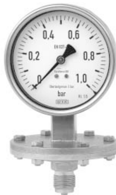
Манометр с пластинчатой пружиной Модель 432.50